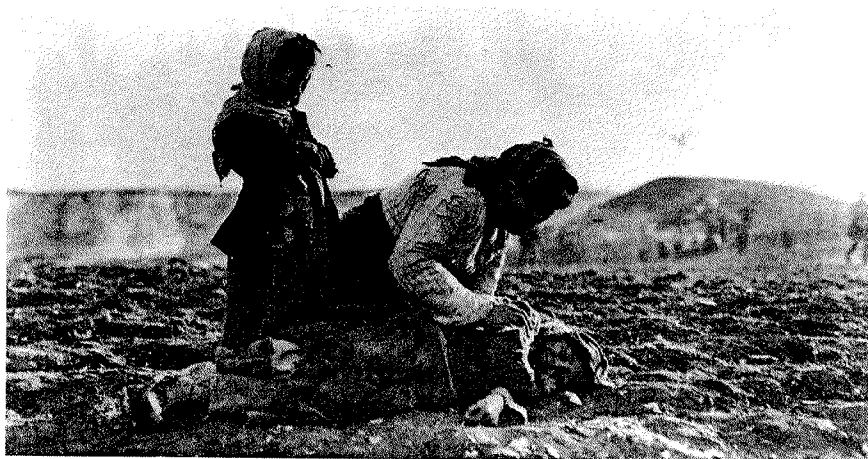
Deportationen av armenierna var i praktiken rena dödsmarscher där främst kvinnor och barn fördes ut i öknen till vad som sades vara omlastningscentra för vidare transport till avlägsna delar av det osmanska riket. Under deportationerna drabbades armenierna av rån, misshandel, våldtäkter och mord. Många dog även av sjukdomar och svält. På bilden ses en armenisk kvinna knäböja bredvid ett dött barn i närheten av Aleppo i norra Syrien.

Tyskland gjorde knappast något för att stoppa massakrerna, men man kan spekulera i om syftet med protesten var att gardera sig mot eventuella framtida anklagelser som kunde komma att riktas mot gärningsmännen. Samtidigt bör det påpekas att den tyska regeringen var noga med att censurera nyheter på hemmaplan om de