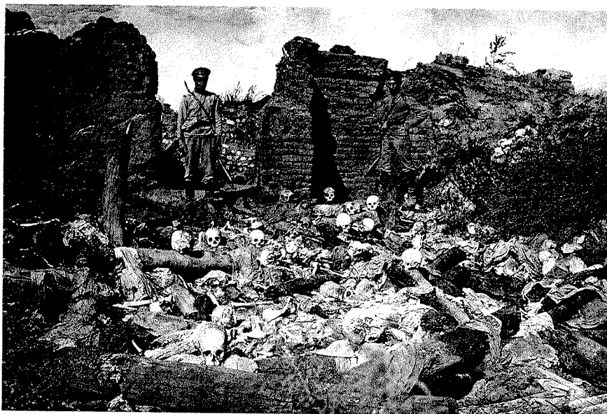
Efter arresteringen av den armeniska eliten i Konstantinopel i april 1915 inleddes pogromliknande aktioner runt om i Anatolien. På bilden ses kvarlevorna av armenier som turkiska soldater låtit spärra in i en byggnad för att bränna dem levande. Fotografiet är taget i Sheykhalan i provinsen Mush i östra Turkiet 1915 sedan soldater i den ryska armén tagit kontroll över området.

gripa redan var i krig med Turkiet. De neutrala länderna, bland andra Sverige, höll sig medvetet undan för att inte riskera att dras in i konflikten.