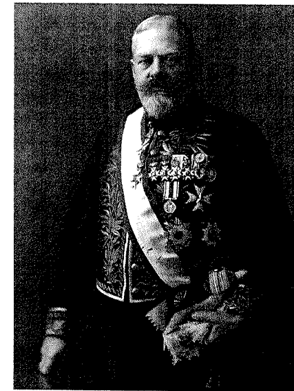
Den svenske diplomaten Gustaf Oskar Wallenberg hade en omväxlande karriär. Han började som affärsman, var politiker under några år och övergick därefter till diplomatien. Han var envoyé och minister i Tokyo 1906–1918 (sedan 1907 ackrediterad även i Peking) och Konstantinopel 1920–1930.

Affärsmannen Gustaf Wallenberg Rapporteringen om Armenien och armenier ändrades dramatiskt under 1920 då en ny envoyé, Gustaf Oskar Wallenberg, tidigare envoyé i Japan och halvbror till tidigare utrikesministern K. A. Wallenberg, anlände till Konstantinopel för att efterträda Anckarsvärd. Gustaf Wallenberg skiljde sig från den traditionella diplomatikåren i flera avseenden: han var inte karriärdiplomat, snarare affärsman, något som kan förknippas med hans familjebakgrund. Men trots rikemannabak-