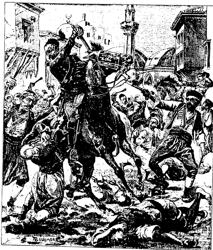
LE STRAGI DI ARMENI A COSTANTINOPOLI. — (disegno di A. Bonner, da schizzo del sero)

LE INSEZIONI A PAGAMENTO Si ricevono ogni volta di più o di meno a piacere. Le tariffe sono in Italia, L. 1.000 all'estero, L. 1.200. Per abbonarsi in Italia e all'estero, inviare il denaro in contante o per mezzo di assegno o di carta di credito.