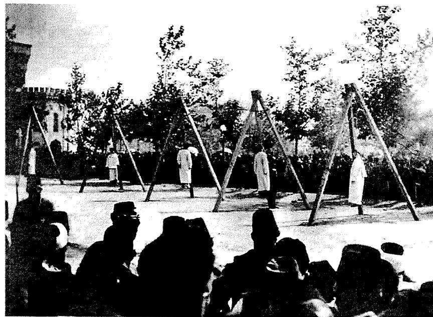
Den ungturkiska regimens beslut att natten till den 24 april 1915 låta arrestera armeniska intellektuella, politiska och religiösa ledare i Konstantinopel inledde folkmordet på de kristna armenierna. Enligt oberoende forskare uppgick antalet offer till mellan 800 000 och en miljon. Det innebär att närmare hälften eller två tredjedelar av den armeniska befolkningen i det osmanska riket utplånades. På bilden tagen i juni 1915 ses avrättade armenier i Konstantinopel. Bildkälla: The Armenian Genocide Museum & Institute, Jerevan.

Tyske ambassadören har skriftligen inskridit hos Porten, men hvad kan Tyskland eller någon annan af stormakterna göra, så länge kriget varar. Att centralmakterna skulle hota Turkiet är ju f.n. otänkbart, och med de flesta af de andra stormakterna är ju Turkiet redan i krig. Efter dettas slut måste Europa åter gripa in här; turkarne göra f.n. allt hvad tänkas kan för att visa hur nödvändigt ett sådant ingripande är. Genom det upprörande sätt, hvarpå man behandlar armenierna, faller Turkiet nu mer än någonsin domen öfver sig själf, men i turkarnes nuvarande kritiska läge och inför det högt flammande främlingshatet, är det troligen lönlöst att söka göra klart för dem vådan häraf. ”On retrouera toujours la Turquie!” [Turkiet är sig alltid likt!] Vål sannt men när , och i hvilket till-