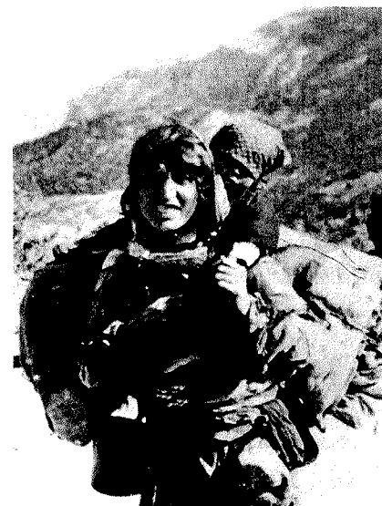
Denna ofta återgivna bild visar en armenisk kvinna på flykt mot okänt öde i Taurusbergen i södra Turkiet 1915. Denna bild och många andra togs i hemlighet av den tyske sjukvårds-officeren Armin T Wegner och utgör en viktig del av dokumentationen kring folkmordet på armenierna. Wegner tillhörde en sjukvårds-enhet som skickades till Mellanöstern sedan Turkiet gått med i första världskriget på Tysklands sida.

Några veckor senare fick Anckarsvärd en kopia av den tyska protestnoten. Han kunde då konstatera att de diplomatiska