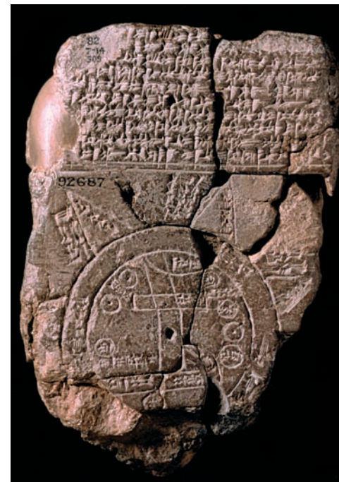
Babylonisk lertavla; den äldsta kända världskartan, 500-talet f. Kr., British Museum - London, Near Eastern

Armenica.org försöker upplysa ovanstående händelser och begrepp närmare och introducera det lilla Armenien med dess urgamla historia för omvärlden. Vårt mål är att presentera Armenien, dess historia och kultur med tillförlitlig fakta och referenskällor och därmed upphöja medvetandet om Armenien och den armeniska nationen.